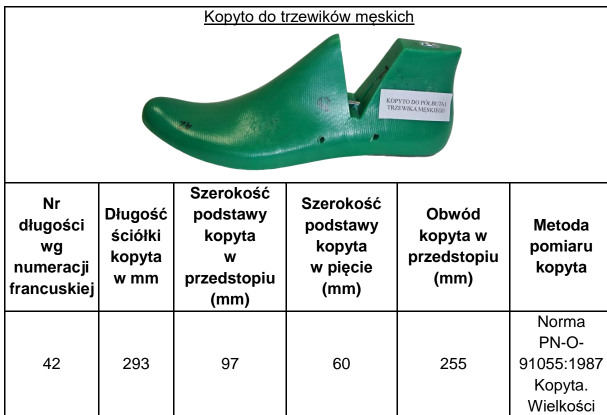
Tab.1. Wymiary kopyta do trzewików męskich o numerze długościowym 42 w numeracji francuskiej

Lasy Państwowe zastrzegają sobie prawo zamówienia obuwia o większej tęgosci.